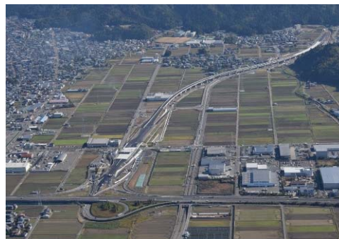
福井県と関東地方を結ぶ最短ルートを成す中部縦貫自動車