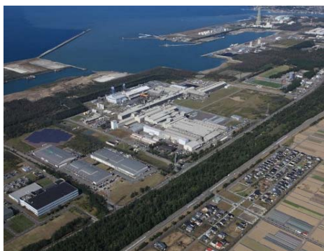
テクノポート福井（福井臨海工業地帯）