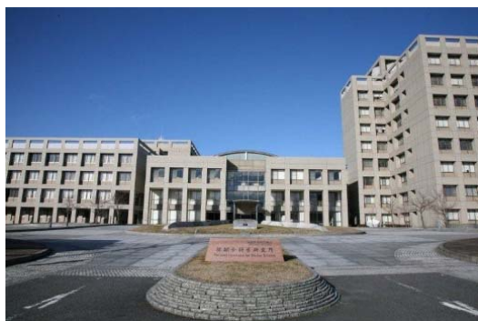
核融合科学研究所 (土岐市・東濃クロスエリア)

山紫水明の豊富な自然に恵まれ、ゴルフ場、スキー場など、観光地も数多くあり、さらには生活コストも安価で住みやすい地域です。