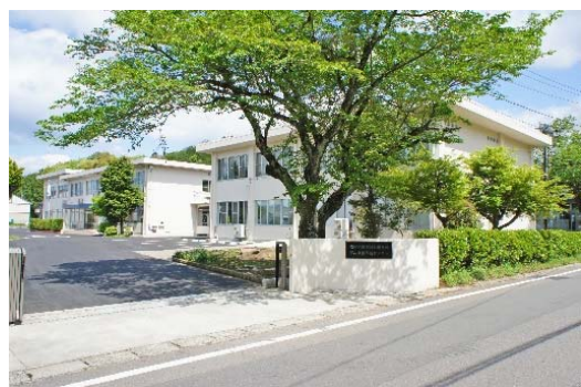
岐阜県工業技術研究所 (関市・航空機クラスター)