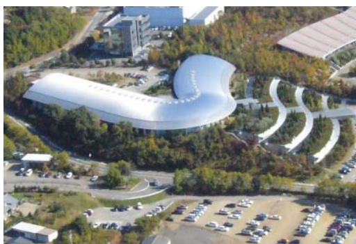
VR テクノセンター (各務原市・航空機クラスター)