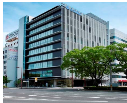
本社ビルの移転 （住友電装株式会社）