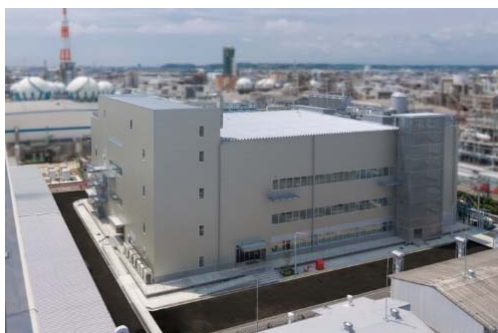
研究開発施設の拡充、機能強化 （JSR株式会社四日市工場）