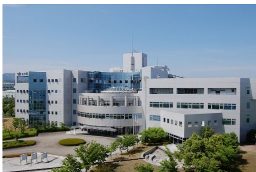
大阪府立産業技術総合研究所 (公設試験研究機関)