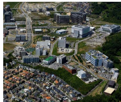
ライフサイエンス分野の研究・技術開発機能等の一大拠点である彩都ライフサイエンスパーク