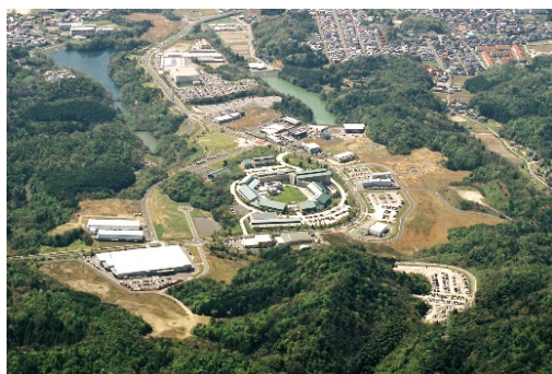
研究開発型企业団地 ソフトビジネスパーク島根