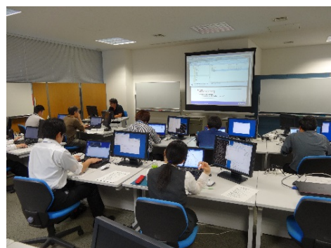
ITエンジニアの育成