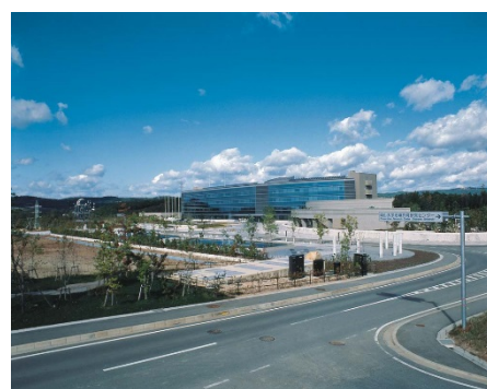
岡山県工業技術センター・テクノサポート岡山