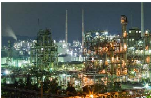
周南コンビナート