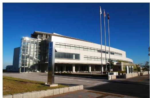
山口県産業技術センター