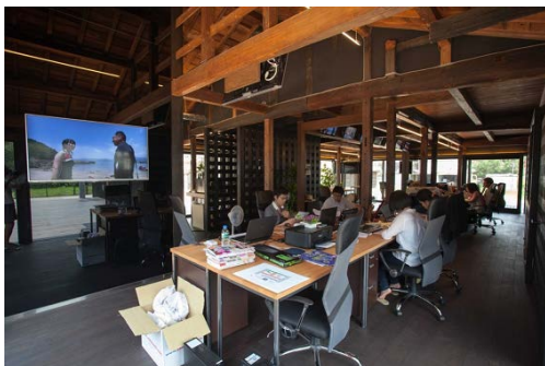
古民家を改修し活用している事業所