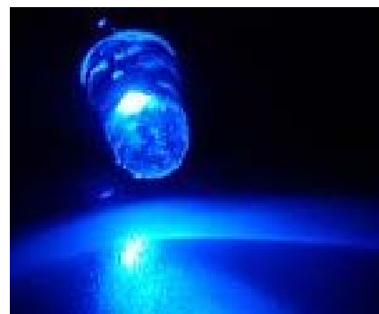
徳島県に本社がある企業の生産する青色LED素子