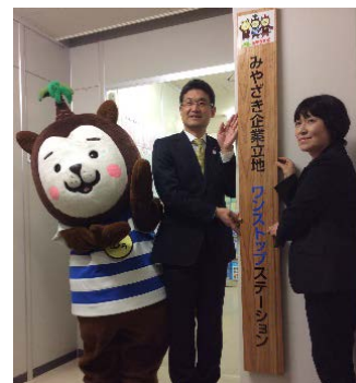
ワンストップステーション（相談窓口）の発足