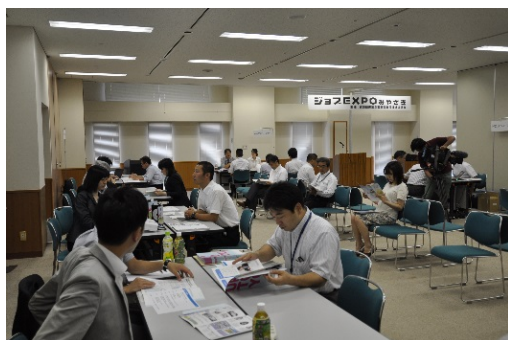
教育機関と IT 企業の連携による就職相談会