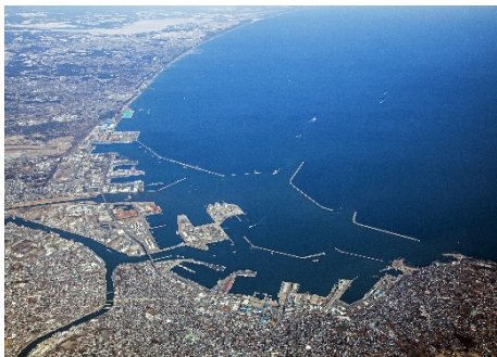
県南・下北地域の産業集積地「八戸市」