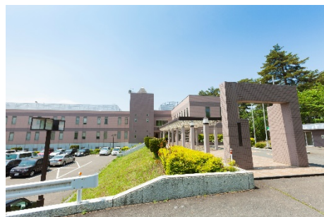
県南・下北地域の産業支援拠点「八戸インテリジェントプラザ」