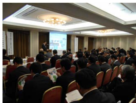
企業立地セミナー