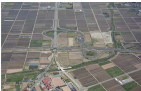
産業団地の整備 (山形中央インター産業団地)

地方における本社機能の強化を行う事業者に対する特例 遊休工場用地等に導入する産業の特例