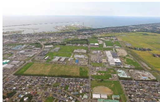
新潟県南部産業団地