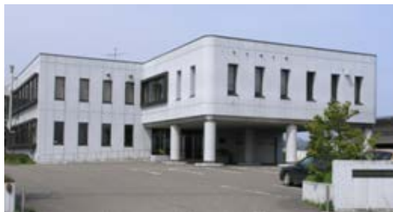
新潟県総合技術総合研究所上越技術支援センター