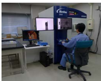
長野県工業技術総合センター 高解像マイクロフォーカスX線検査装置