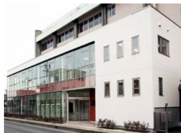
長野県工業技術総合センター 食品技術部門しあわせ信州食品開発センター