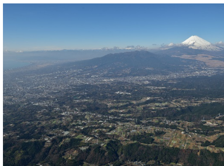
三ツ谷工業団地計画区域