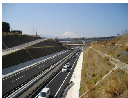
東駿河湾環状道路三島塚原 I C