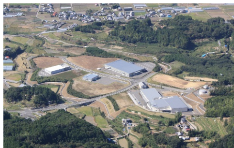
高知工科大学との連携を可能とした大学隣接型工業団地「高知テクノパーク」