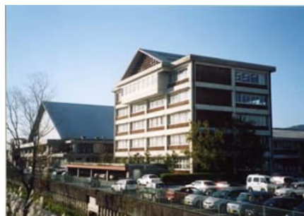
産業支援の中核的機関である産業振興センター