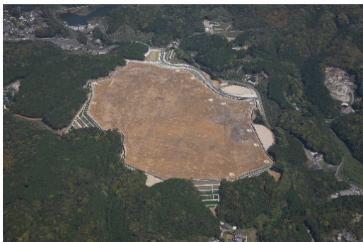
パールテクノ西海（H27分譲開始）