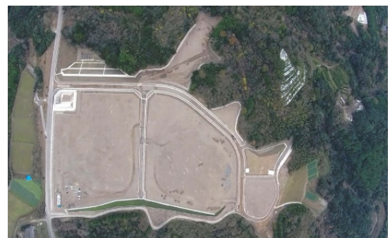
ウエストテクノ佐世保（H25分譲開始）