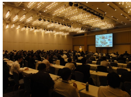
熊本県企業立地セミナー