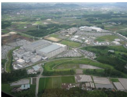
半導体関連企業が立地する工業団地「セミコンテクノパーク」