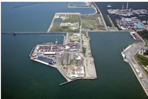
秋田湾産業新拠点と秋田港