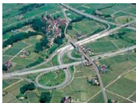
整備された高速道路網