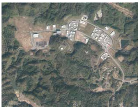
いわき四倉中核工業団地