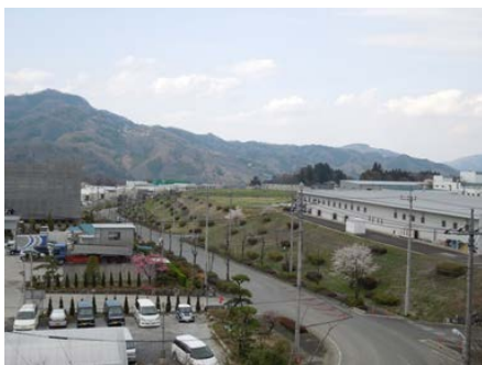
秩父みどりが丘工業団地