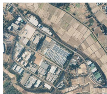
川本春日丘工業団地（深谷市）