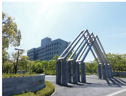
奈良先端科学技術大学院大学