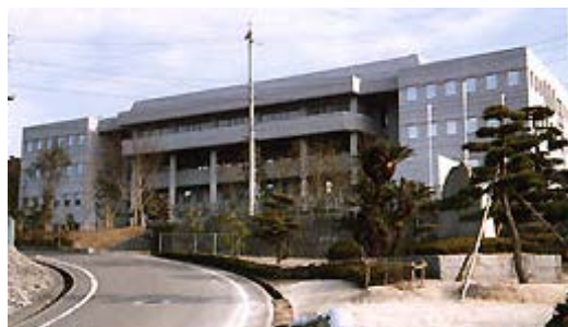
愛媛県農林水産研究所