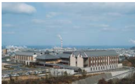
愛媛県産業技術研究所 紙産業技術センター