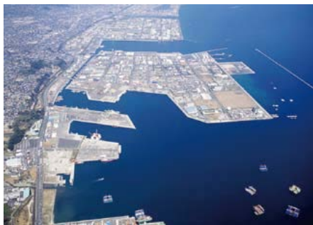
60万都市鹿児島市に位置する大規模工業地帯（鹿児島臨海工業地帯1号用地）