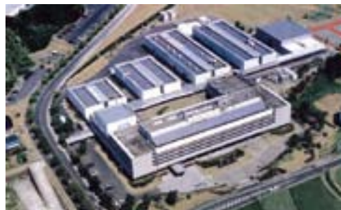
県内企業の技術的拠りどころ（鹿児島県工業技術センター）