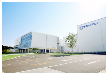
首都圏中央自動車道沿線の阿見東部工業団地