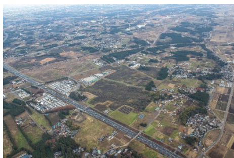
常磐自動車道と北関東自動車道の結節点に位置する茨城中央工業団地