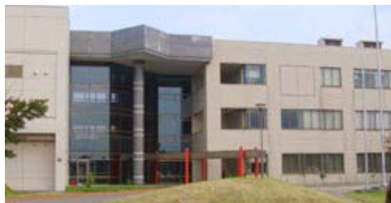
新潟県立三条テクノスクール