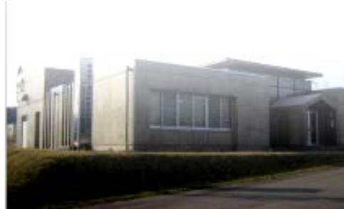
新潟県工業技術総合研究所研究開発センターレーザー・ナノテク研究室