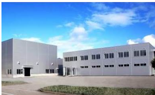
ものづくり産業振興の拠点「富山県ものづくり研究開発センター」