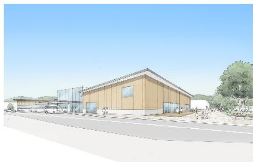
複合型拠点施設の外観イメージ

まち・ひと・しごと創生寄附活用事業に関連する寄附を行った法人に対する特例（地方創生応援税制）