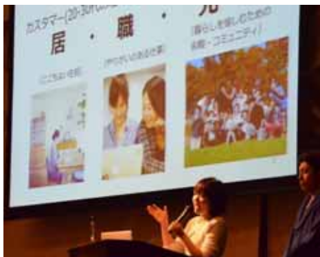
とまち・イノベーション・プログラム発表会