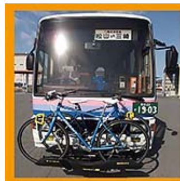
サイクルバス等を活用した二次交通の利用促進