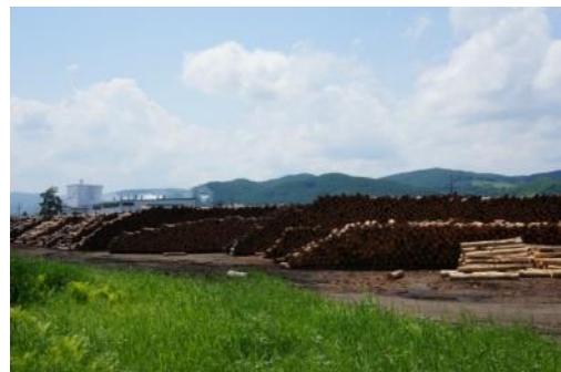
木材・木製品の付加価値額、特化係数が北海道内でトップ