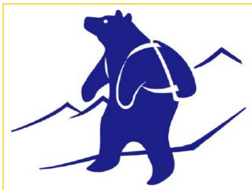
知床新たなブランド