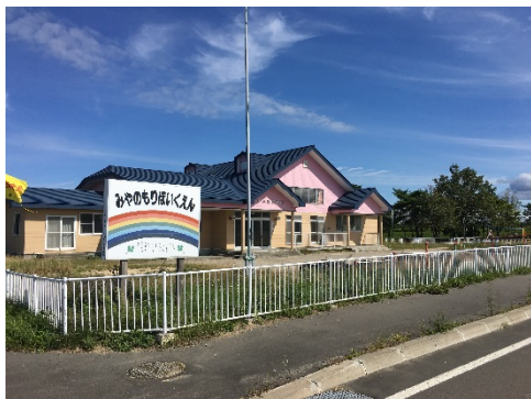
改修予定の旧宮の森保育園（外観）