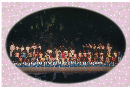
<住民参加型ミュージカルの様子（H13）>

これらの流れをいかに活用して、幅広い年齢層の人々を巻き込み繋がりを強めて行けるか。さらに、そうして強めた地域コミュニティを軸にした町外からの人材交流を深め新たなつながりを派生させる事が出来るかが大きな課題の1つとなっている。