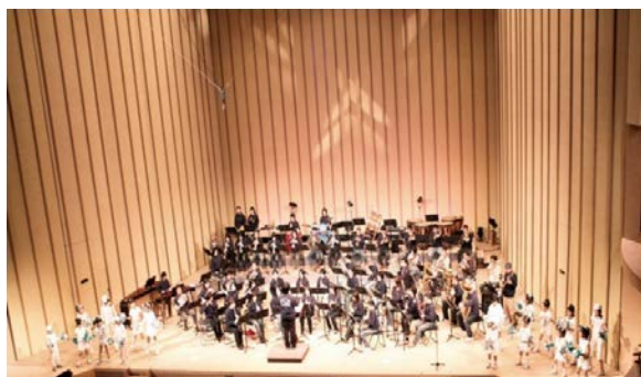
<地元楽団と子どもたちの公演の様子（H13）>