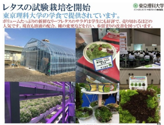
レタス試験栽培（植物工場）