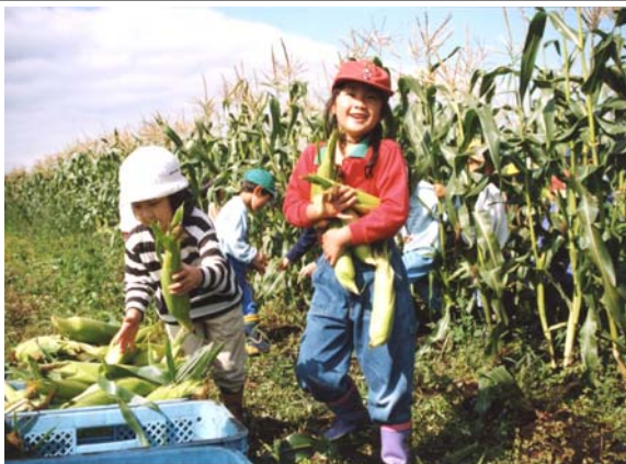
安全・安心な大地の恵み