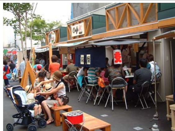
食の観光資源「北の屋台」