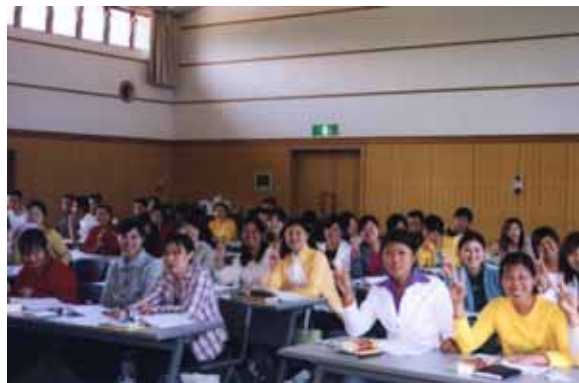
中国からの研修生たち