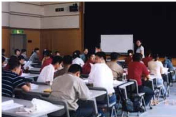
外国人研修風景（非実務）