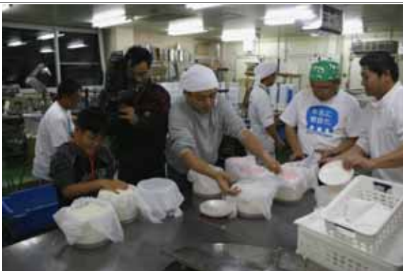
チーズ作り講習会