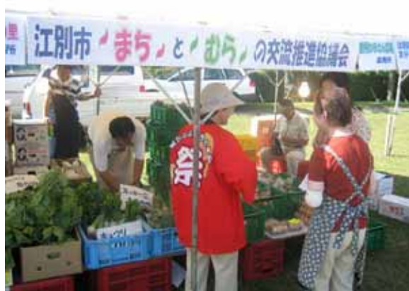
まちとむら協議会