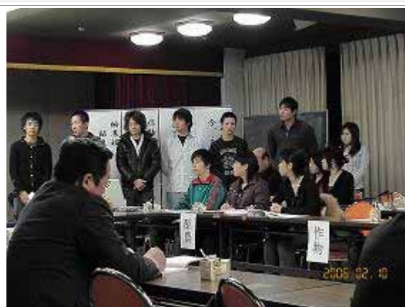
産学官連携シンポジウム