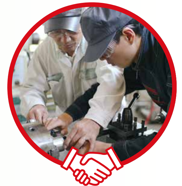
●三井造船(株) 玉野事業所内の技能研修センターにて

造船業を基幹産業とする市において、地元企業の即戦力として活躍できる優秀な人材を育成する事業に対し、市内で創業し、現在も事業所を置く三井造船(株)が、市長のトップセールスを受け、6,500万円の寄附を行う予定。