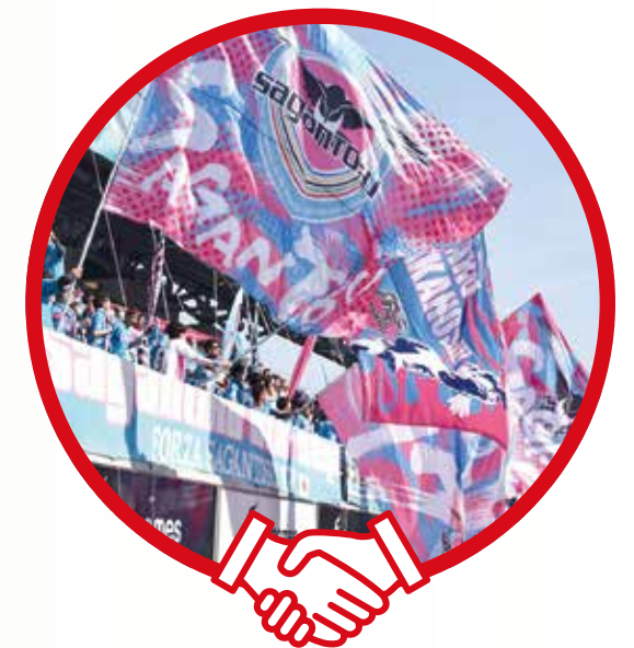
●サガン鳥栖 ベストアメニティスタジアムにて

サガン鳥栖のオフィシャルスポンサーである(株)Cygames(社長が佐賀県伊万里市出身)が、3年間で総額6億8,600万円の寄附を行う予定。