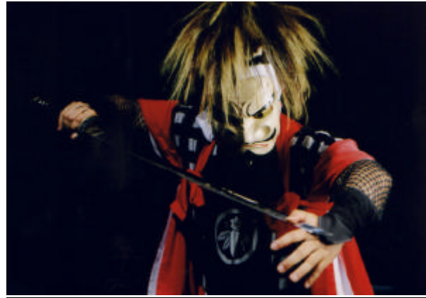
北上市を代表する民俗芸能「鬼剣舞」