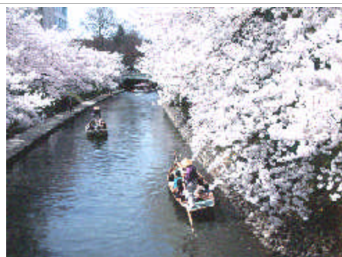
松川遊覧船での花見（富山市）