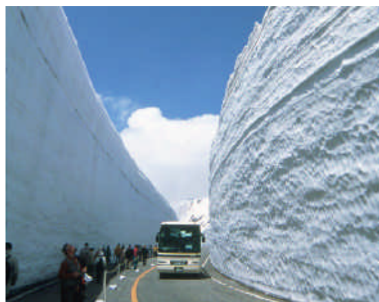
立山黒部アルペンルート 雪の大谷