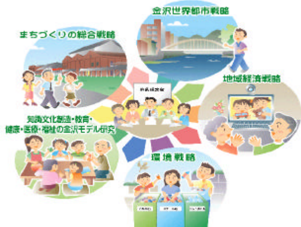
市民による都市政策研究