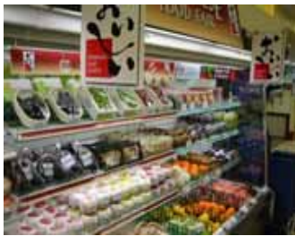
常設店舗事業の様子 (タイ)