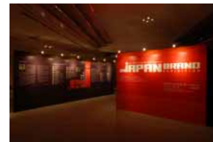
JAPANブランドの展示会