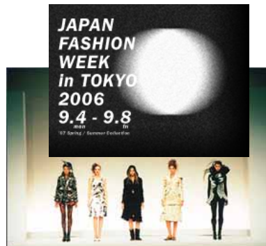
新人デザイナーファッション大賞