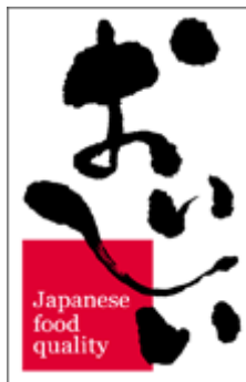
日本食材輸出促進 のロゴマーク