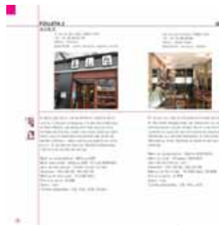
推奨ガイドブック