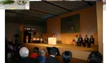
食育推進全国大会