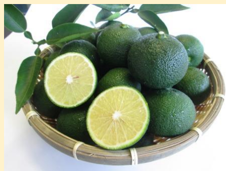
当市特産品「へべす」の差し入れ