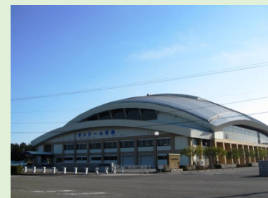
サンドーム日向 (スポーツ教室会場)