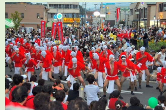
日向ひよっこ夏祭り