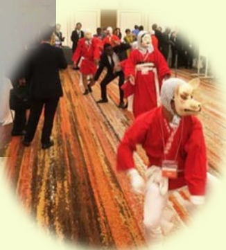
日向ひよっこ踊り