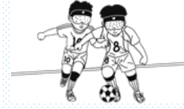
ブラインドサッカー