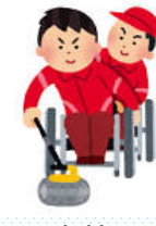
車椅子 カーリング

※「交流及び共同学習」の機会については、体育を含めた各教科や「総合的な学習の時間」等での取組が考えられる。