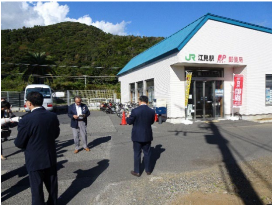
・江見駅郵便局外観