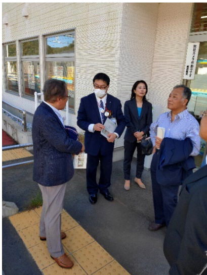
・ホームで業務について説明を受ける。