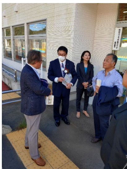
・ホームで業務について説明を受ける。