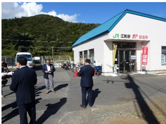
・江見駅郵便局外観