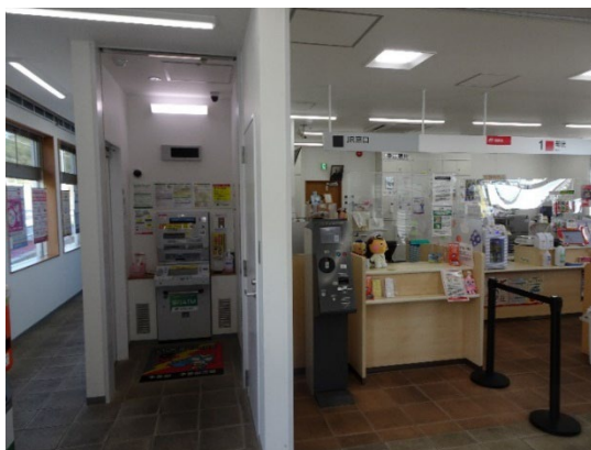
・左からATM、JR窓口、郵便局窓口