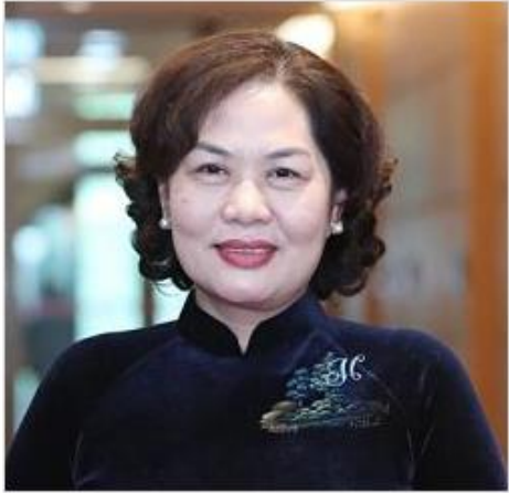
グエン・ティ・ホン氏 国家銀行（中央銀行）総裁