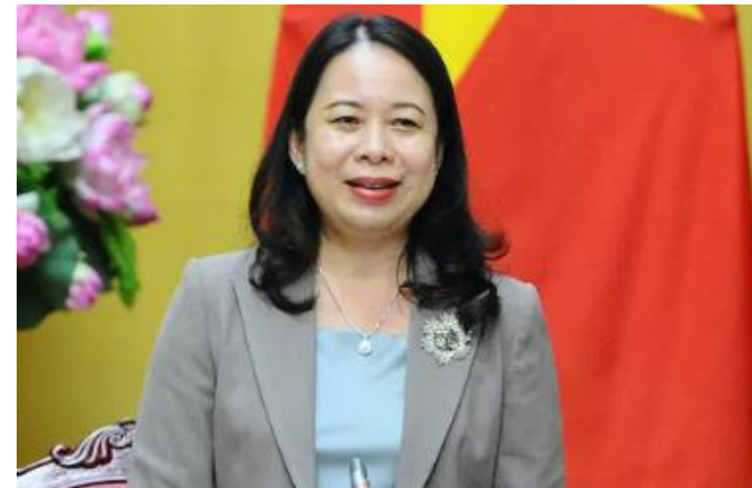
ポー・ティ・アイン・スアン氏 国家副主席