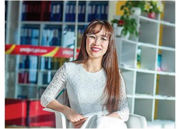
グエン・ティ・フオン・タオ氏 ベトジェットエアCEO