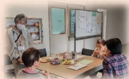
こころのケアセンターの活動の様子