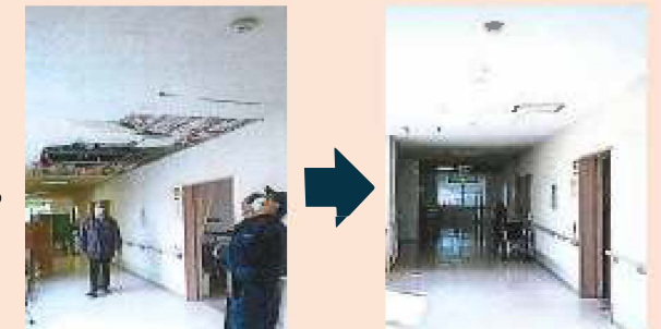
介護施設の復旧の様子