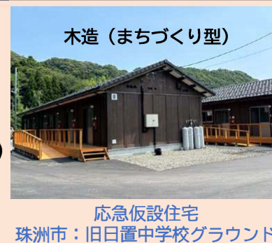
応急仮設住宅 珠洲市：旧日置中学校グラウンド